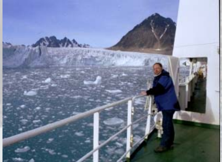
Een heerlijk zonnetje maakt deze ervaring compleet..

het jagen. Dit jaar helaas niet, maar het uitzicht vergoed alles. Wat is dit mooi!!