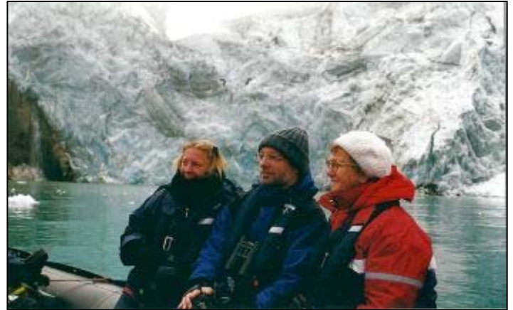
Met z'n driën bij de kleine gletsjer van Kapp Fanshawe.

Het is weer vervelend mistig als we de Hindelopenstraat in varen. Op zee valt het nog mee, maar de kust is geheel in nevelen gehuld. Op de tast varen we naar de vogelklippen van Kapp Fanshawe. Het is laat in het seizoen en het grote spektakel van overvolle klippen met broedende zeevogels is al voorbij. Enkele late zeekoeten zijn nog met hun jong op de smalle richels aanwezig. Toch nog redelijk wat vogels zijn hier nog aanwezig. Naast de zeekoeten zijn er ook drieteenmeeuwen, grote burgermeesters met jongen, kleine alken en een enkele papegaaiduiker.