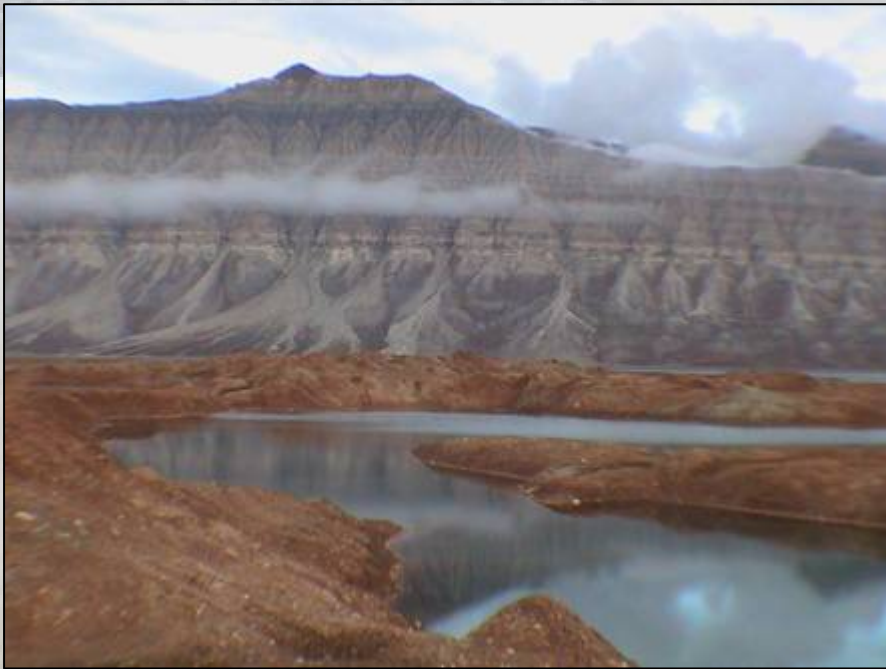
Ekmanfjord: Dit eiland is het resultaat van een rond 1900 op drift geraakte gletsjer.

We zijn aan onze laatste dag begonnen. Komende nacht om drie uur gaan we van boord. We dachten een rustig dagje tegemoet te zien, maar niets is minder waar. Twee excursies met een stevige wandeling en vanavond tot het ontschepen een cruise langs de mooiste plekjes van de Isfjord.