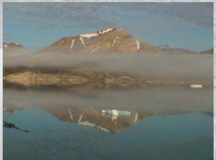
Van Smeerenburg is op het prachtige uitzicht na niet veel meer terug te vinden.

's Avonds is het weer gezellig in de bar. We zijn langzaam aan een gezellige familie geworden.