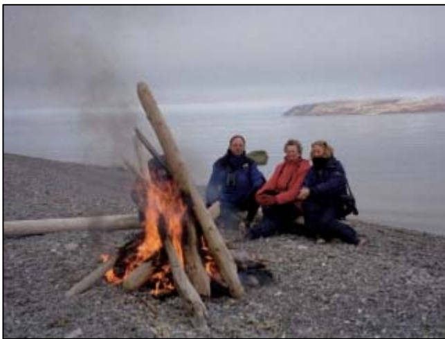
Het opgeruimde zwerfafval wordt verbrand.

's Middags zouden we een zware wandeling gaan maken naar een mooi uitzichtpunt. Het zit dubbel tegen. Het is zwaar bewolkt en het uitzicht is belabberd. Als we ter plekke komen blijken we bovendien te worden opgewacht door een ijsbeer. Precies op de plek waar we de beklimming zouden doen. We gaan nu een stuk verderop aan land.