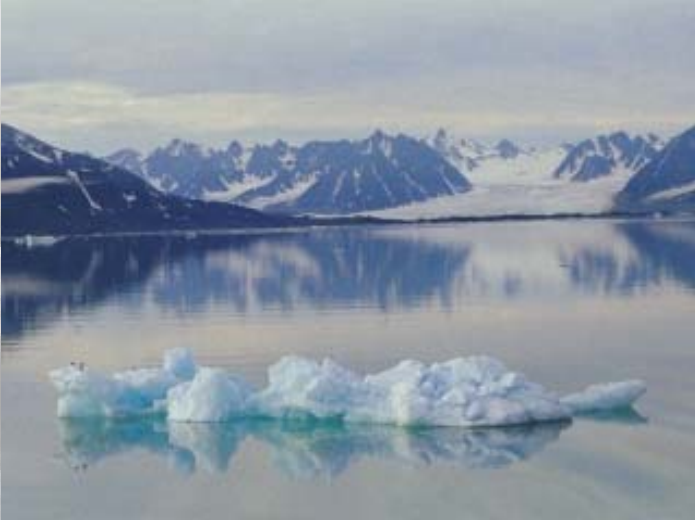
Van de gletsjer afgefallen brok ijs.

Het is prachtig weer als we de Liefdefjord in varen. Aan het eind van de fjord is een fantastisch mooie gletsjer van 5 km breed. De zon kleurt alles helder wit als we de hoge gletsjerwand naderen. Het is een schitterende gletsjer. Niet zo'n steile gletsjerwand, maar een wat rommelige brokkeltaart. Achter de gletsjer doemen schitterende rotsen op met die kenmerkende spitse punten. Het wemelt van de meeuwen. Er is helaas te weinig ijs voor de zeehonden. Doorgaans liggen er zeehonden op ijsschotsen en zijn er hier ijsberen in het water aan