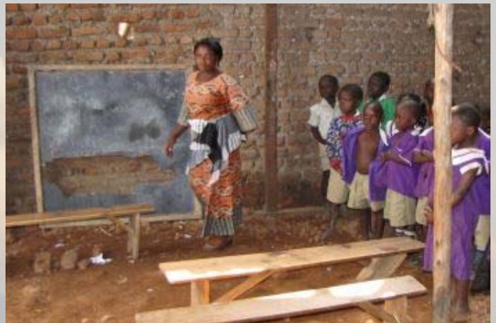
Ondanks de hulp is een schoolbord nog een luxe.

Het weeshuis is uitgegroeid tot een schooltje voor de hele gemeenschap, al blijft het vooral een opvangcentrum voor kinderen die hun ouders hebben verloren. De wezen wonen rondom de school, maar ook gewone kinderen kunnen er gebruik van maken. Als we aankomen worden we door maar liefst 300 kinderen verwelkomd. De lessen worden onderbroken en iedereen komt samen op de binnenplaats. Er wordt muziek gespeeld, gedanst en gezongen. Wij geven onze vanuit Nederland meegenomen giften. Een druppel op de gloeiende plaat. De directeur houdt een toespraak en ook Rob zegt namens ons een paar woorden. De klasjes zijn erg klein, maar bevatten soms wel meer dan 40 kinderen. Twee kinderen vertellen ons dat ze beide ouders hebben verloren, ik vermoed in de burgeroorlog die zich hier op enkele kilometers afstand in Congo heeft afgespeeld en ook nu nog regelmatig opvlamt.