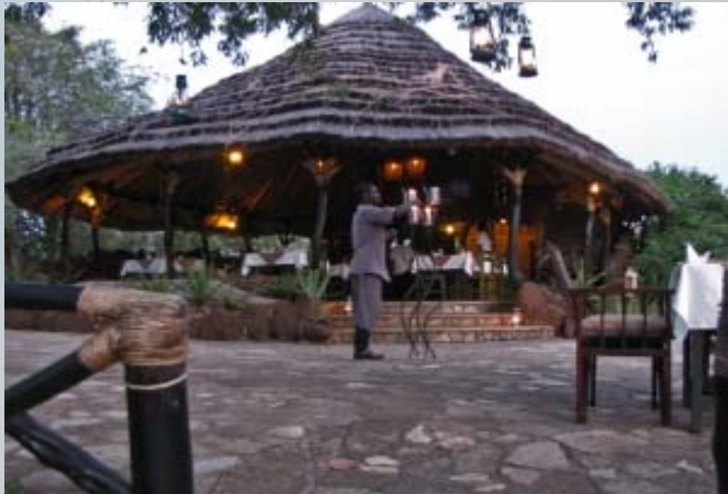
's Avonds romantiek in de Nile Safari Lodge.

Zonder verdere problemen komen we aan het eind van de middag aan in de Nile Safari lodge. Een juweel van een onderkomen. We hebben een hutje op palen met uitzicht op de Nijl, waar de nijlpaarden luider hun aanwezigheid verraden. In de boom voor ons speelt een groepje apen (vervet monkeys). De douche is het vermelden waard. Elke ochtend en op verzoek wordt er in een ton heet water gegooid en kun je in de buitenlucht warm douchen. Het is hier helemaal geweldig. Bij het restaurant kun je op sofa's genieten van het uitzicht. 's Avonds is het complex verlicht met olielampen. Goede omstandigheden voor een heel romantisch diner.