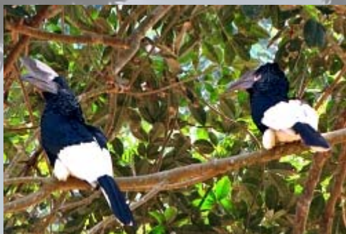
Neushoornvogels in de Botanisch tuin van Entebbe.

Een relaxte dag. Lekker een beetje uitslapen en hierna naar de botanische tuin van Entebbe. Hier kun je naast wat aparte bomen vooral veel vogels bewonderen. De meesten in de groep vinden het leuk om vogels te kijken, zonder dat ze fanatiek zijn. We zien o.a. veel enorme neushoornvogels, de grote blauwe turaco, ijsvogels en twee soorten apen. Grappig is dat de eerste Tarzanfilm hier is opgenomen. Vervolgens gaan we het drukke Kampala in om geld te wisselen. Wij wisselen 700 euro en