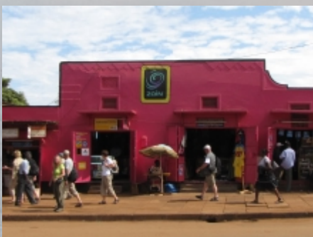
Karakteristieke Oegandese 'supermarkt'