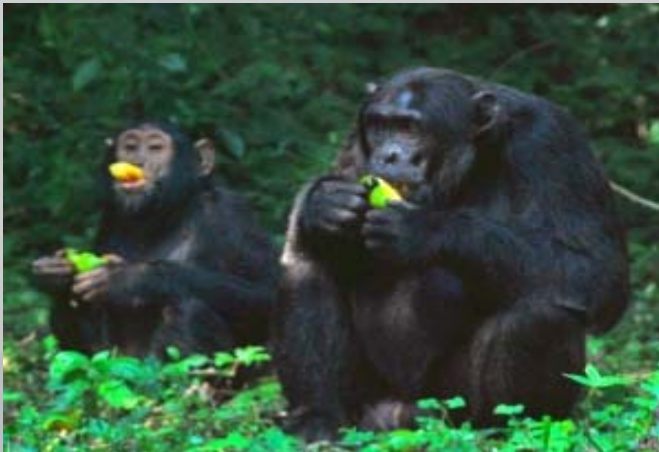
De chimpansees gaan vlak naast ons zitten !

vloog werden de camera's gericht. Een van de mannen heeft de pest in. Hij kwam hier voor een speciaal vogeltje en heeft hem na een hele dag speuren niet gevonden. We moeten ons haasten om voor donker terug te zijn. De gate van het park, die om 18:30 dicht gaat, doen ze tegen zevenen gelukkig nog open. Van hieruit is het nog 8 km naar Pabidi over het gatenpad, maar we redden het voor het pikkedonker is. De hele tent blijkt verlaten. Alle jonge bezoekers zijn terug naar Kampala om morgen op tijd op het werk te zijn. Een bijzondere dag met een zwart randje.