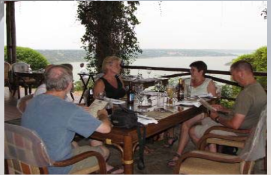
De mooie Mweya lodge.