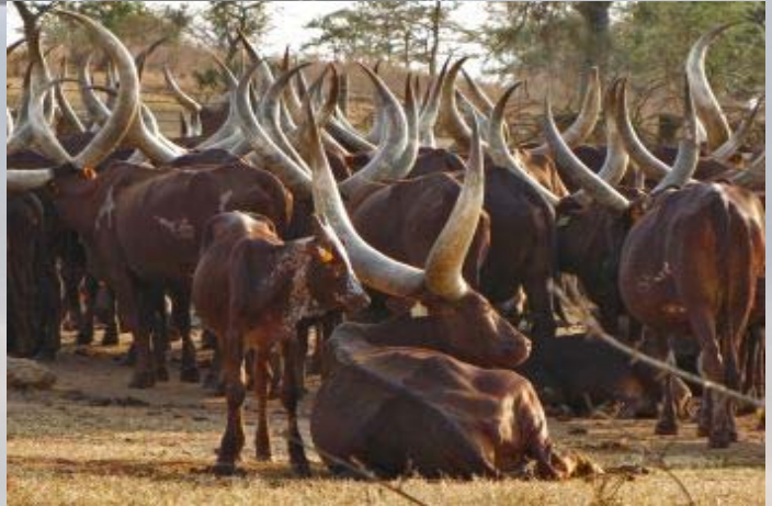
In het zuiden van Oeganda wordt het aparte Ankole vee gehouden.

Rondom Lake Mburo leeft de Ankole stam. Zij bezitten runderen met enorme horens, Ankole koeien genoemd. Net buiten het park staan er duizenden. Er schijnt morgen markt te zijn en alle koeien staan bij elkaar te wachten op de handelaren. Een imposant gezicht.