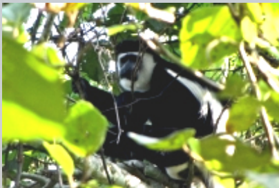
Colobus monkey (franjeaap)