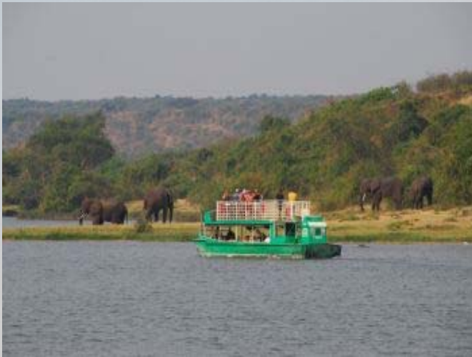
Hoogtepunt: Boottocht over het Kazinga kanaal.

Hoogtepunt van het park is een boottocht over het kanaal en die gaan we dan ook zeker maken. We nemen de boot van 15 uur. Het is een geweldige tocht. Aan de kant drinken de olifanten en in het water poedelen de buffels tussen de nijlpaarden. We zien ontelbare ijsvogels, waaronder vele prachtige malanchite kingfishers. Vlak buiten een dorpje hebben honderden pelikanen, ooievaars en aalscholvers zich verzameld. Waarschijnlijk wachtend op een eenvoudig maaltje visafval. Na twee uur kicken zijn we terug in de lodge en genieten voor onze kamer met wat nootjes en een glaasje wijn van het uitzicht.