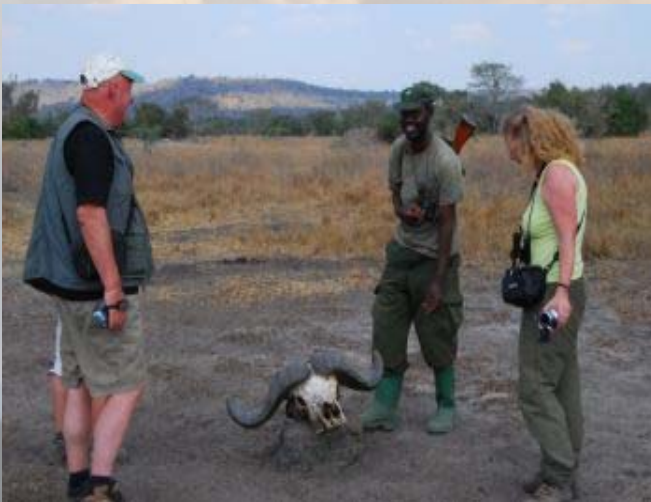
In het Lake Mbuuro park maken we een wandelsafari.

Het is inmiddels laat geworden en de gewenste gamedrive langs het meer, beschreven als beste optie in het park, zit er helaas niet meer in. Na een korte stop aan de oever van het meer rijden we het park uit. Onderweg zien we weer veel wild, waaronder een boom vol gieren.