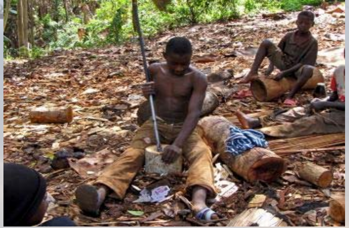
Dorpje waar iedereen bezig is met het vervaardigen van drums.