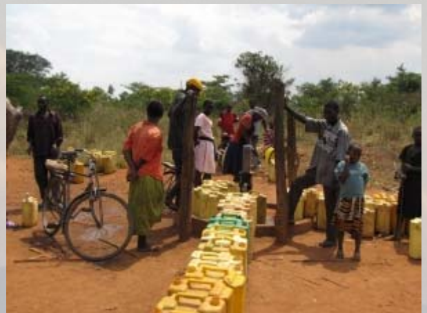
Uren in de rij voor een jerrycan water.

Na de wandeling rijden we terug naar Hoima en nemen de route via Lake Albert naar ons grote doel van deze week, de Murchison Falls. De (om)weg moet spectaculair zijn en één van de mooiste routes van Oeganda. Degene die dat geschreven heeft was waarschijnlijk dronken, want het is een vrij eentonige weg met slechts eenmaal even uitzicht op Lake Albert. We krijgen helemaal spijt van deze omweg als de weg heel erg slecht blijkt te zijn. Een leuke band kan dan ook niet uitblijven.