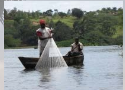
Vissers op het Victoriameer