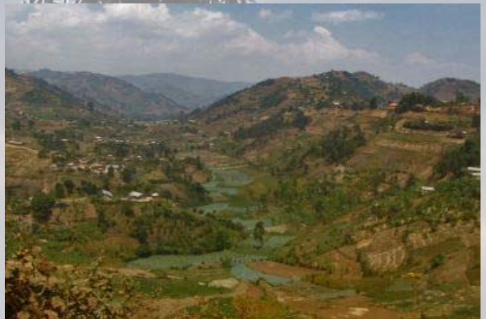
Het zuidwesten van Oeganda.

Vandaag gaan we weer verder. Eerst hobbelen we een uur terug naar Kisoro. Hier bezoeken we de markt en wordt het thuisfront van nieuws voorzien. We lunchen bij het vermaarde Traveller's nest guesthouse, de plek waar Diane Fossey (van 'Gorilla's in de mist') haar thuisbasis had. Er is markt in Kisoro en dus lekker druk. Vrouwen in prachtige gewaden paraderen met spullen op het hoofd door de stad. Kisoro ligt aan de grens met Congo en Rwanda. Net buiten de stad zien we nog de restanten van de enorme vluchtelingenkampen uit de tijd van de recente burgeroorlogen. Zo te zien keven er nog steeds mensen. We zijn blij dat we niet lang in deze stad hoeven te vertoeven. De concurrent van Matoke, Habari travel, is eigenaar van Traveller's nest en in hun reizen is altijd een paar dagen in deze plaats opgenomen.