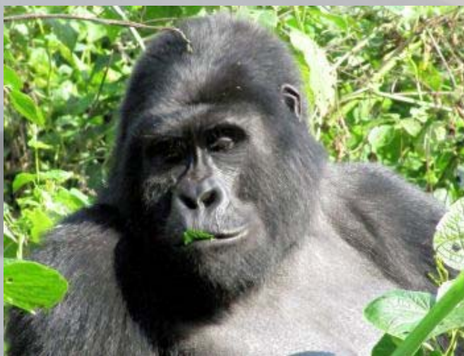
Het dominante mannetje (de 'zilverrug').

Normaal gesproken tolereert de leider geen concurrenten, maar zijn even oude broer wordt tot ieders verrassing getolereerd. Bij de broer heeft zich ook een zilveren rug gevormd en het is de vraag of ze over een paar jaar nog steeds samen zijn. De mannetjes zijn ongeveer 200 kg zwaar. Kinderen vergeleken met de oude Nkuringo die wel 400 kg zwaar was.