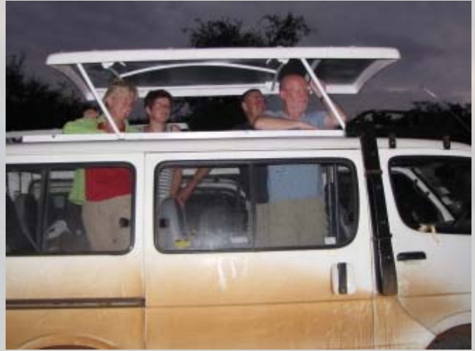
Vanuit de bus heb je een geweldig uitzicht.