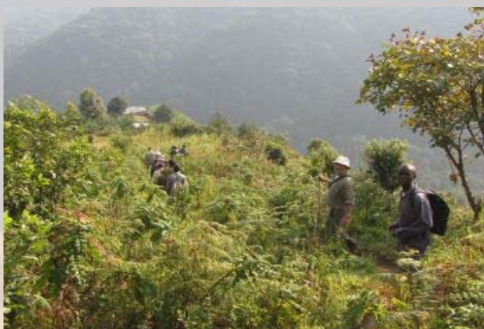
De afdaling naar Bwindi.

In Oeganda leven in het Bwindi Impenetrable Forest nog zo'n 300 berggorilla's verdeeld over 12 families. Het park is met zijn 331 vierkante kilometer één van de grootste overgebleven jungles in Afrika. Ook in het verderop gelegen Mgahinga (kleinste park van Oeganda) tegen de flank van het Oegandese deel van de Virunga vulkanen leven berggorilla's. De groep die wij gaan bezoeken bevindt zich in een toegankelijk deel van het Bwindi park. In Bwindi is het mogelijk twee families te bezoeken. Binnenkort komen daar twee families bij. De populairste is de Nkuringo groep, bestaande uit 18 gorilla's. De enorme zilverback Nkuringo is helaas vorig jaar overleden (ouderdom) en heeft een jong mannetje (Safari) het leiderschap overgenomen. De tocht naar de groep kan erg zwaar zijn. De dieren kunnen zich 1 km per dag verplaatsten, waardoor de zoektocht soms uren kan duren. Gidsen houden bij waar ze de nacht hebben doorgebracht en kunnen aan de hand van afgebroken takken zien welke kant ze op zijn gegaan. Gorilla's zijn planteneters en ondanks hun enorme kracht en reputatie in films als King Kong bijzonder vredelievend.