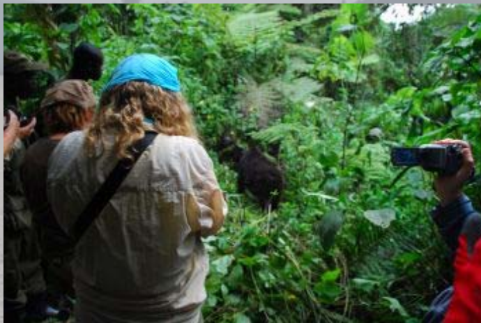
In het dichte oerwoud vinden we na de berggorilla's.

In ons groepje zitten ook een Nederlands en Belgisch stel. De Nederlanders zijn een apart stel. Zij is een beetje een 'uit de hoogte tutje' met laknagels, die het toch erg leuk vindt om de meest wilde dingen te doen. De Belgen zijn erg sympathiek. Ze reizen met een eigen gids door Oeganda. Zij heeft enorm veel last van haar rug en heeft een injectie tegen de pijn genomen om deze trip in