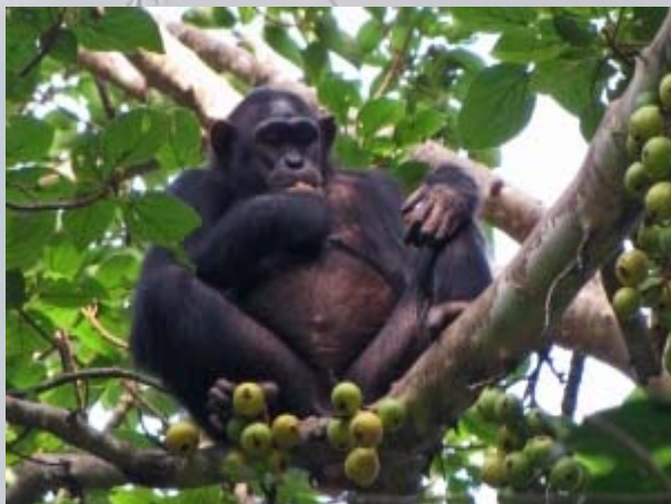
Chimpansee hoog in de boom.

We zijn vroeg op voor onze chimpansee tracking. Met gids John en vier Ieren gaan we op pad. Na enig zoeken vinden we een chimpansee in een fruitboom. Hij zit erg mooi, maar blijkt een eenling te zijn.