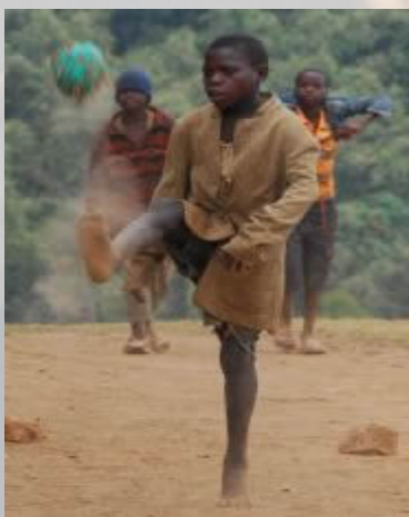
Ook bij de Pygmeëën is voetbal populair. Een bal is echter niet meer dan met touwen vast gebonden plastic.

De regering heeft weinig gedaan om deze mensen op te vangen. Ze kregen de meest onvruchtbare berg toegewezen en zitten hier nu op een kluitje lekker uit te sterven. Geen toekomst, geen uitzicht. In en in triest. De van oorsprong jagers hebben weinig affiniteit met landbouw en brengen hun dagen doelloos door. Bezoekende toeristen wordt om geld gebedeld, iets wat in handboeken en door sommige groepsleden wordt afgedaan als inhalig, lui en onsympathiek. Een mening die ik absoluut niet deel. Ik denk dat het heel moeilijk is om zomaar om te schakelen van jager naar landbouwer. Apathie is het gevolg van uitzichtloosheid, niet van luiheid. We hebben makkelijk lullen vanuit onze luie stoel en genoeg geld op de bank.