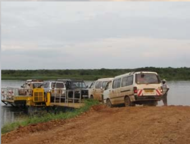
Murchison Falls : Pontje over de Nijl.