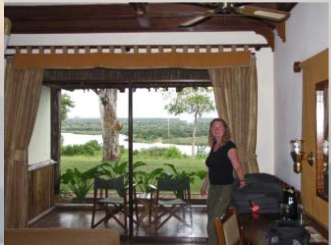
De luxe Paraa lodge.