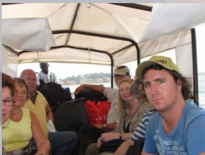
Met de boot over het wilde Victoria meer.