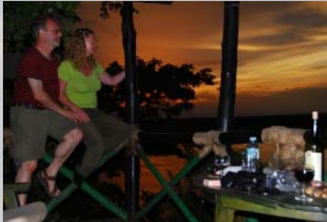
Vanaf ons terras een prachtig uitzicht over de Nijl.