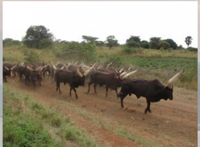
Het typische Ankole vee uit deze streek.

Het begint hard te regenen als we in Jinja aankomen. We komen langs een festival waar we de mensen alle kanten op rennen om beschutting te zoeken. Ons hotel in het prototype van vergane glorie. Het wordt gerund door Indiërs, die nog nooit van het woord service hebben gehoord. De kamers zijn kleine gevangenissen, veel lichtpunten werken niet, de douche werkt niet en een aantal kamers heeft geen handdoek en zeep. Gelukkig is het wel schoon. Het is