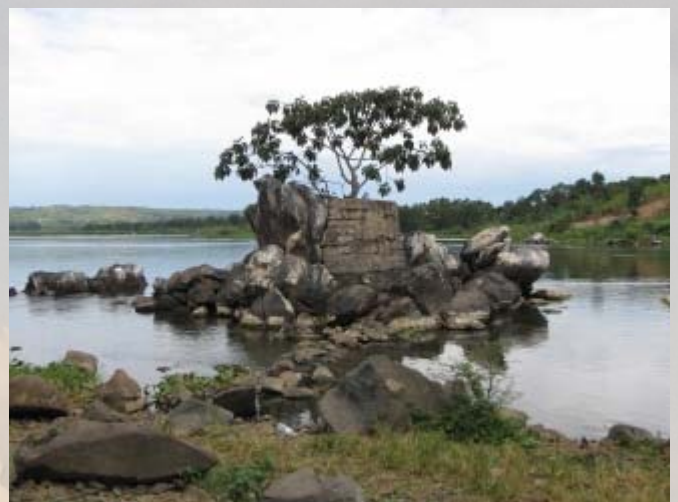
Op deze plek ontspringt de Nijl uit het Victoriameer.

Na de boottocht lunchen we bij een restaurantje aan het water. Ook hier een dusdanig trage bediening dan we ons geld terug moeten vragen voor de bestellingen die we nog niet hebben gehad. Anders hadden we er de hele middag gezeten. We gaan naar het centrum van Jinja. Het is de op één na grootste stad van Oeganda, maar vergeleken met Kampala is het een provinciedorpje. We bezoeken de markt. Zoals zo vaak in dit soort landen is de markt kleurrijk, erg leuk, maar enorm smerig. Vlees wordt gehakt en gesneden, autobanden tot schoenen gesneden en fruit in enorme bakken verhandeld. Kortom een vrolijke chaos. Een gedeelte van de markt is ingericht voor de naaisters. Honderden zitten er naast elkaar. Ze herstellen kapotte kleding en maken van allerlei lapjes nog iets bruikbaar. In een klein hoekje van de markt worden 'duistere spullen' verkocht. Hier wordt aan voodoo gedaan. Je kunt er huiden van apen, verdovende middelen en andere 'zwarte magie' spullen krijgen. In kleine hokjes zitten mensen bijeen die ons wantrouwend aankijken. Snel wegwezen dus.