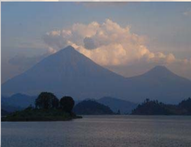
De Virunga vulkanen op de grens van Rwanda, Congo en Oeganda.

Tegen de avond maken we met een elektrisch bootje van de lodge een kort tochtje in de buurt. Lekker relaxed, maar het stelde eigenlijk helemaal geen fluit voor. 's Avonds zitten we na het eten nog een tijdje gezellig op ons balkonnetje te genieten van de geluiden om ons heen. Het is een heerlijk plekje.