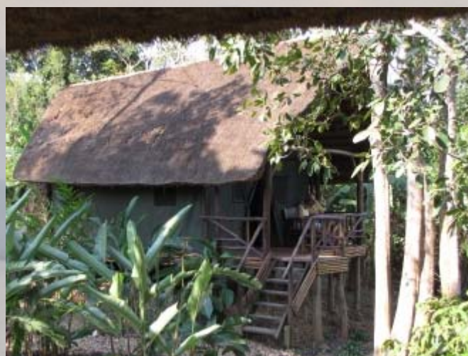
Ons relaxhotel "Lagoon lodge". Een heerlijke plek.