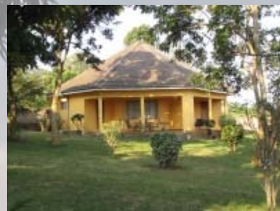
Ons hotel in Kampala, waar we de groep ontmoeten.