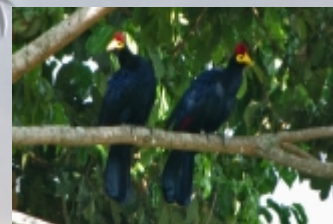
De grote blauwe turaco

Een relaxte dag. Lekker een beetje uitslapen en hierna naar de botanische tuin van Entebbe. Hier kun je naast wat aparte bomen vooral veel vogels bewonderen. De meesten in de groep vinden het leuk om vogels te kijken, zonder dat ze fanatiek zijn. We zien o.a. veel enorme neushoornvogels, de grote blauwe turaco, ijsvogels en twee soorten apen. Grappig is dat de eerste Tarzanfilm hier is opgenomen. Vervolgens gaan we het drukke Kampala in om geld te wisselen. Wij wisselen 700 euro en