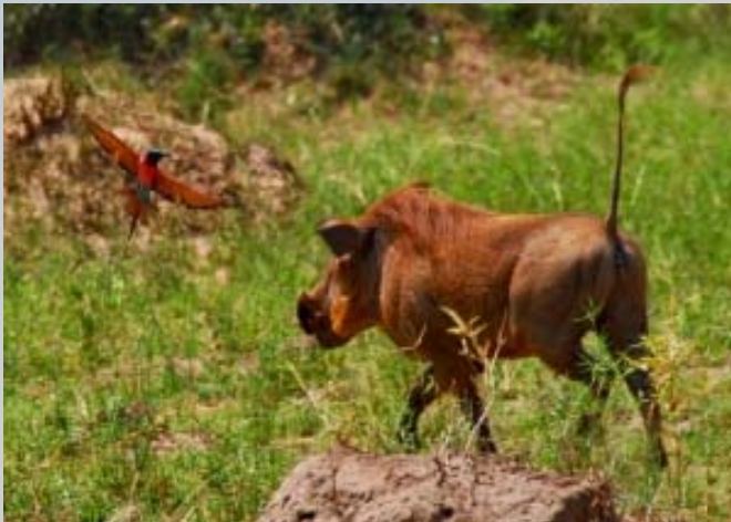
Carmine bijeneter vliegt op van de rug van een warthog.