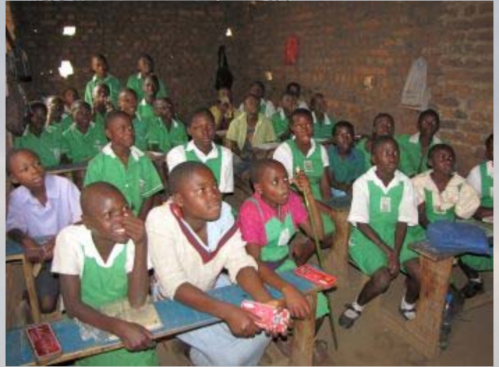
In Oeganda hebben alle schoolkinderen uniformen.

We vertrekken al vroeg in de richting van de grens met Congo. Hier is een door Matoke ondersteund weeshuis. Het project wordt ook ondersteund door de man van een vorig jaar overleden vrouw. Zij maakten vorig jaar met Matoke 'onze' groepsreis. Rob was ook toen de reisleader. Er werd toen een populaire vleermuizengrot bezocht, waar ook cobra's leven die zich voeden met de vleermuizen. Tijdens deze excursie is ze in contact gekomen met het beruchte en uiterst besmettelijke Marburg virus (lijkt op ebola). In Nederland is ze hieraan overleden. Rob, haar man en andere groepsleden waren gelukkig niet besmet maar zijn aan de dood ontsnapt. In de Quest heeft hierover een heel artikel gestaan, inclusief een grote foto van het stel samen met Rob voor de ingang van de grot. Bizar. De man heeft ter nagedachtenis aan haar een weeshuis 'geadopteerd' en steunt het financieel. Matoke bezoekt elke reis het weeshuis en zorgt zo voor aanvullende financiën.