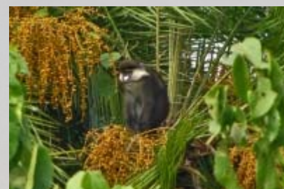
Apen (red tailed monkeys) in de tuin

Als iedereen is voorzien rijden we naar een afgelegen plek waar het bootje klaar ligt dat ons naar de Lagoon lodge zal brengen. De niet zo solide ogende boot wordt helemaal afgeladen, waarna we in een uur over het ruwe Victoria naar onze bestemming varen. Met een houten kont, maar wel droog (in tegenstelling tot o.a. Jaap) komen we aan bij de Lagoon lodge. Het is hier fantastisch leuk. We hebben een huisje op palen, waarin een luxe safaritent is geplaatst. Er zijn vijf huisjes, precies genoeg voor iedereen. Elk huisje heeft een balkon met uitzicht op de bosachtige tuin. Vanaf de warande zien we de roodstaart apen in de bomen spelen, terwijl de grote neushoornvogels en enorme turacos af en aan vliegen. Een droomplekje. De rest van de middag doen we niets en genieten we op ons balkon van alle dieren en vogels die voorbij komen. 's Avonds zitten we gezellig rond het kampvuur en komen alle verhalen los. Erg gezellig.