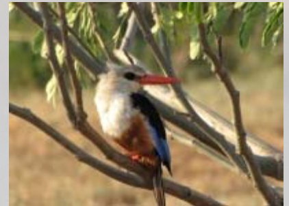
Mooie ijsvogel vlak voor ons huisje.

Vanuit Hoima rijden we over een onverharde weg vol gaten naar de Lake Albert lodge aan het Albert meer. Een hele slechte weg en over de 76 km doen we bijna 3 uur. De beloning is groot. De lodge ligt