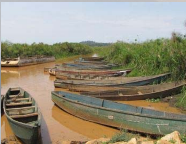
De Mabamba swamp. Hier leven een paar schoenbekooievaars.