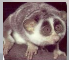
Potto.