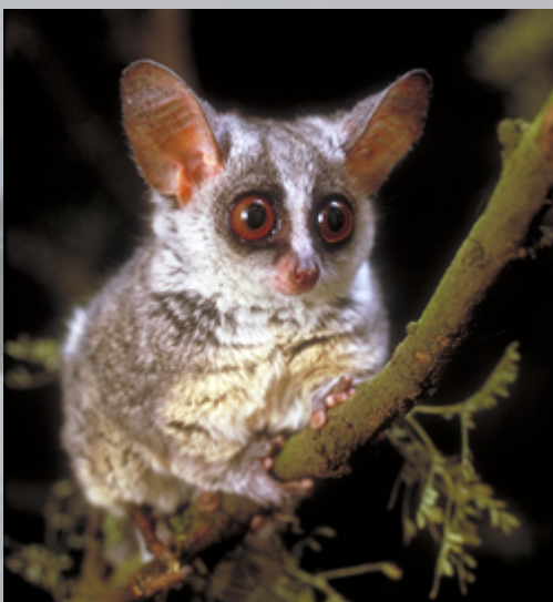
Galago (Bushbaby).