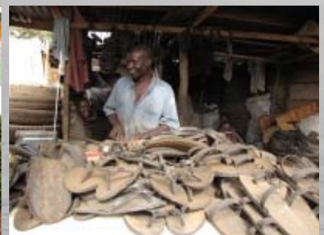
Markt: Schoenen van autobanden.