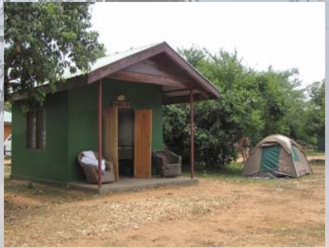
Het primitieve, maar gezellige Red Chili Camp.

Om 23:30 zoeken we pas met de knijpkat ons hok op. Snel tanden poetsen en naar bed.