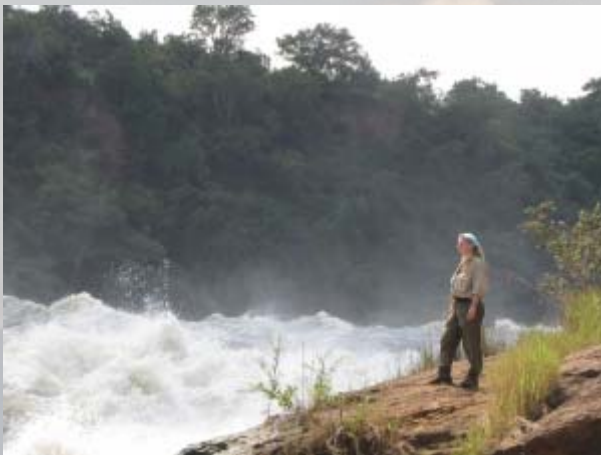
De wilde Nijl stort zich naar beneden.

De weg naar de bovenkant van de watervallen is, net als in dit deel van het park, erg slecht. We zijn in Kampala voor dit stuk gewaarschuwd. Regelmatig gaan hier auto's over de kop. Als we hier later met de groep zijn, zien we op één dag zelfs twee gecrashte auto's.