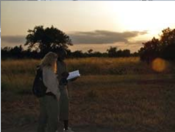
De afdaling naar de Lake Albert.

We hadden vooraf een uitstapje naar een vissersdorp geregeld, maar kiezen vanmorgen voor een wandeling door het reservaat. De dieren zijn vrij schichtig door de vele stropers die hier rond lopen en ze maken zich snel; uit de voeten als ze ons zien. Het vogelleven is uitbundig en kleurrijk. De mooiste zijn de felrode Bisshop, een 'langstaartige fladderaar' en natuurlijk