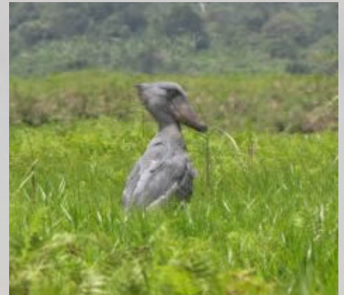
De zeldzame schoenbekooievaar.

Even na de drummakers gaan we de weg af. Via een lang hobbelpad komen we bij een moeras aan de oever van het Victoriameer. In dit moeras van 6 km 2 bevinden zich negen zeer zeldzame schoenbekooievaars (Shoebills). Met een uitgeholde boomstam varen we met de enthousiaste gids en zijn peddelaar het moeras in. Het eerste stuk gaat door een met paarse lelies omzoomd kanaaltje door het hoge riet. Het is hier vrij druk met roeiboten die uit het aan de overkant gelegen Entebbe komen. Als we het 'grote' kanaal verlaten hebben we het moeras voor ons zelf. We varen naar een open plek waar de shoebill vanmorgen nog is gezien. Weinig hoopgevend is dat een Japanner met enorme telelens zonder resultaat terug komt. Wij hebben meer geluk. Na 45 minuten slaakt de gids een vreugdekreet. Hij heeft hem gevonden! Diep in het riet en vrij lastig te zien. Het is een 'vreemde vogel'. Nadat hij wat ontdekt is er een hele discussie geweest of het nou een prehistorisch dier, een ooievaar of een reiger is. Uiteindelijk hebben ze hem ooievaar genoemd, maar de wetenschappers houden het op een aparte soort.