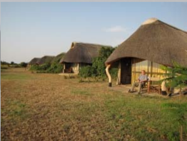
De fraaie Lake Albert lodge

direct aan het meer en we hebben een fantastisch huisje met uitzicht. De kleurrijke vogels, waaronder prachtige bijeneters en knalblauwe ijsvogels, vliegen massaal om ons heen. Er zijn ook twee Belgen waarmee we gezellig op het verhoogde terras een biertje drinken. De lodge ligt in een klein natuurpark, waar voornamelijk Oeganda cobs (een soort antilope), sierlijke oribi's (kleine gazelle) en warthogs (zwijnen) leven. Daarnaast wordt er in het park olie gewonnen, bron van een machtsrijd tussen de natuurorganisaties en oliewinners. Wie er gaat winnen lijkt me helaas duidelijk. Het eten is fantastisch en we genieten van dit echte begin van onze vakantie. 's Avonds is er op het meer een waar lichtspektakel. Vissersboten varen massaal het meer op en lokken de vissen met lampen. Duizenden lampjes toveren het meer om tot een sterrenhemel.