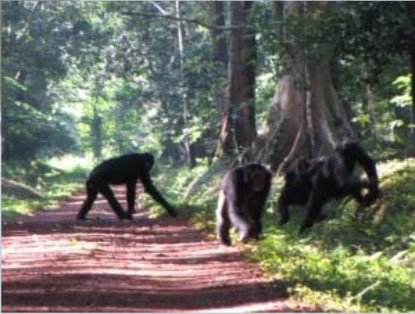
Plotseling komt er een grote groep chimpansees uit het bos.

Plotseling horen we vlakbij een enorm gekrijs. Chimpansees! Zitten die hier dan?? De gids bevestigt het. We willen er naar toe, maar we mogen niet van de weg af. Langzaam lopen we op het geluid af. Plotseling komt er een chimpansee uit de bosjes! En nog één, en nog één! Een groep van 25 dieren steekt de weg over en gaat vlak voor ons rustig zitten. Overal om ons heen chimpansees!! We kunnen ons geluk niet op. Op hun gemakje eten ze grote gele vruchten. We moeten zelfs wat naar achteren om niet te dichtbij te komen. We genieten bijna een uur van dit schouwspel. Dan besluit de leider dat het genoeg is en verdwijnen ze één voor één weer de dichte jungle in. Iets verderop stonden de hele tijd drie vogelaars. Ze keken niet op of om. Alleen als een grijs vogeltje langs