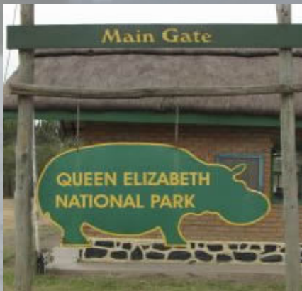
De ingang van het park

Rond het middaguur worden we uitgezwaaid en rijden in anderhalf uur naar het Queen Elizabeth park. Hier splitst de groep zich. De ene helft zit in een nieuw guesthouse net buiten het park, maar wel midden in de natuur. Wij hebben samen met de andere helft twee nachten geboekt in de chique Mweya lodge. De lodge ligt op een heuvel aan de oever van het Kazinga kanaal. Vanuit onze kamer kunnen we beneden in de verte de olifanten zien drinken! Een unieke plek.