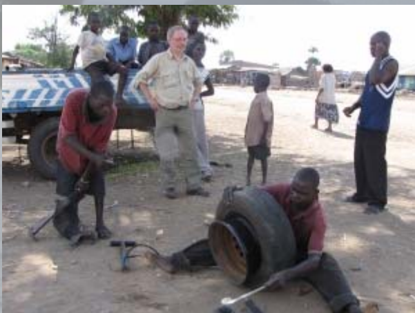
Twee lekke banden worden geplakt.

Bij de afslag naar Butiaba worden we door wat jongens geattendeerd op een lekke band. Er is meteen actie. Ik krijg niet de kans zelf wat te doen en met vereende kracht wordt de band verwisseld. Als het is gebeurd blijkt de reserveband ook zacht te zijn. Gelukkig zitten we 7 km van Butiaba af. Wat een geluk, want de volgende 100 km komen we geen dorp meer tegen. Met de halfzachte band rijden we langzaam naar het primitieve vissersdorp. Daar wordt de plaatselijke mecanicien opgetrommeld. Hij gaat eerst even de 'compressor' halen, wat een fietspomp blijkt te zijn. De man is straatarm. Versleten schoenen van autoband en zijn kleren vol gaten. Binnen drie kwartier is de lekke band geplakt en de zachte reserveband opgepompt en gecontroleerd ('geen gaatjes'). Met angst en beven vervolgen we onze weg.