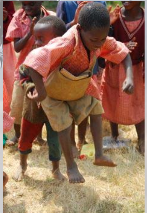
Voor we het dorp bezoeken wordt er gezongen en gedanst door de kinderen.

Via een heftige hobbelpweg bereiken we de Nkuringo lodge aan het kleine Mutanda meer. Het is een superplek, toevallig onlangs in een reisprogramma bestempeld als 'hemel op aarde'. We hebben allemaal een eigen grote tent, geplaatst op een vlonder op palen. Iedereen heeft uitzicht over het meer, met in de verte de drie hoge Virunga vulkanen. Fantastisch. We komen op het terras even lekker bij van de toch nog lange rijdag Na het eten kaarten we nog een paar potjes, maar gaan vroeg naar bed om goed voorbereid te zijn voor de gorillatrek van morgen.