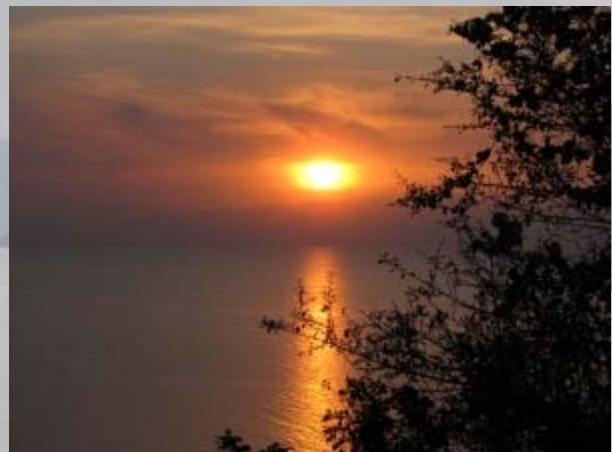
's Avonds uitzicht over Lake Albert