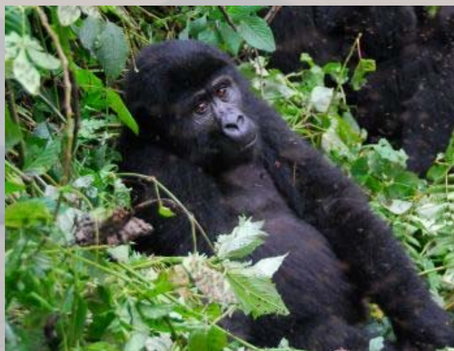
Een 4-jarig mannetje.

Even bevinden de gorilla's zich op een open plekje en kunnen we ze goed zien. De open plek is helaas ook door ontelbare vliegen ontdekt, zodat het ook nu onmogelijk is om goede foto's te maken. We zien de tweeling lekker spelen en twee jonge broers omarmen elkaar liefdevol. Vertederend! Eenmaal komt de grote zilverrug recht op ons af. We worden volkomen genegeerd en hij loopt onverstoord vlak langs.