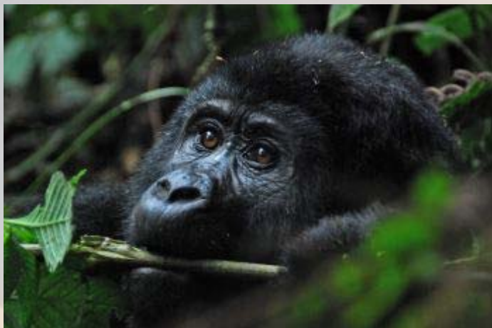
De met uitsterven bedreigde berggorilla.

Beneden bij de rivier komen we de eerste gorilla in het dichte oerwoud tegen. Een stukje verderop is de rest van de groep. De begroeiing is zo dicht dat er niets terecht komt van die minimaal 7 meter afstand. Om ze te zien komen we soms tot op 1 meter afstand! De gidsen tellen 16 verschillende dieren, waaronder twee silverbacks (zilverruggen) en een vrouwtje met een 9 maanden oude tweeling. Een kleintje van een paar jaar speelt als een grappig bolletje in een boom. Het is helaas te donker om mooie foto's te maken. De groep heeft twee silverbacks. De silverback is het dominante mannetje. Als deze leider van de groep is, wordt zijn rug grijs als teken van dominantie. Na het overlijden van Nkuringo vorig jaar is Safari de nieuwe leider.