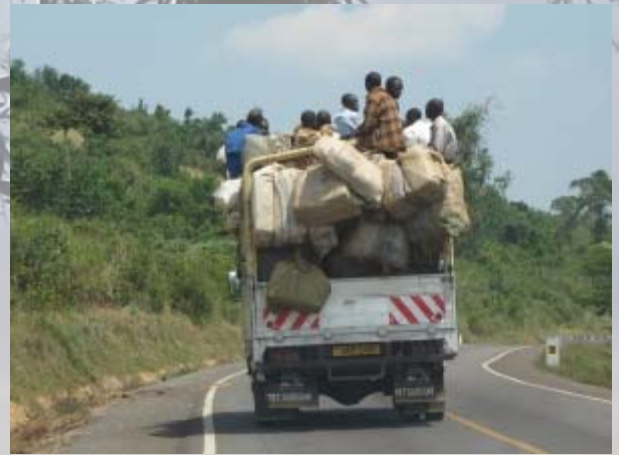
Openbaar vervoer in Oeganda

Vlak buiten Kampala is het een vrij drukke weg met veel minibussen en irritante verkeersdrempels. Langzaam raakt Kampala uit zicht en laten we de chaos achter ons. Oeganda is een groen land en heel anders dan bijvoorbeeld het droge Kenia. De weg naar Hoima is vorig jaar geasfalteerd en dat scheelt een paar uur. We hebben de ruim 200 km dan ook binnen 3 uur afgelegd. Hoima ligt in het westen van Oeganda en is een beetje de oliehoofdstad van het land. Overigens geen reden om de straten te asfalteren of de kuilen in de weg te dichten.