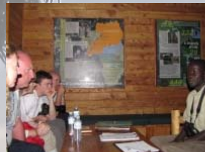
Briefing voor de chimpansee tracking.

Na een kwartiertje gaan we op zoek naar andere chimpansees. Die laten zich echter niet zien en na drie uur gaan we toch ietwat teleurgesteld terug. Erg jammer. De grote groep van 80 schijnt een paar maanden terug uit het gebied getrokken te zijn. Waarom weet niemand, maar de mensen van Pabidi fluisteren dat het wel eens met de vele toeristen te maken kan hebben. Per dag zijn er 2 keer 2 groepen van 6 mensen op pad en dat zou wel eens teveel van het goede kunnen zijn. In ieder geval halen ze bij lange na de in folders aangegeven 90% kans om ze te zien niet meer.