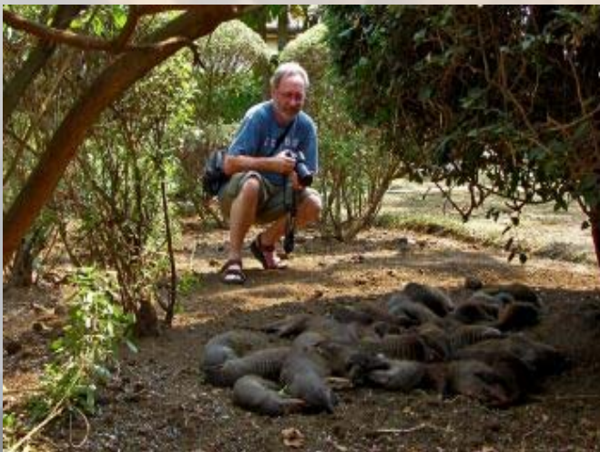
Voor de deur van de kamer ligt een groep mangoesten te slapen.

Na de ietwat teleurstellende kloofwandeling rijdt Sam ons weer terug naar de lodge. In het restaurant hebben we een heerlijke lunch met uitzicht. In de struiken boven ons hoofd (wijnranken ?) ontdekken we twee kameleons. Een groene en een lichtblauwe. Op het terrein loopt meer wild rond. Rondom de huisjes struinen warthogs rond en voor onze deur ligt een hele familie mangoesten (mongoose) onder een struik te slapen. Ze lijken wel dood! De mangoesten hebben ook kleintjes, die geen zin hebben om te rusten en speels over hun uitgetelde moeder dartelen. Hartstikke leuk.