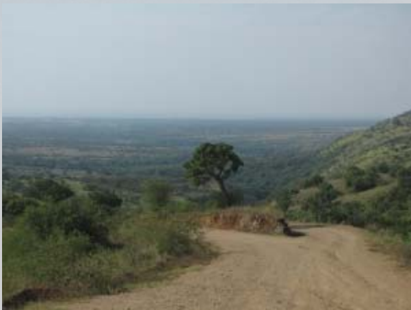
De afdaling naar de Lake Albert.

Vanuit Hoima rijden we over een onverharde weg vol gaten naar de Lake Albert lodge aan het Albert meer. Een hele slechte weg en over de 76 km doen we bijna 3 uur. De beloning is groot. De lodge ligt