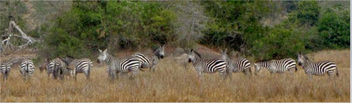
Lake Mbuuro is één van de weinige plekken in Oeganda waar zebra's leven.

Een van de redenen dat de rest van de groep niet mee is, is dat Rob vertelde dat hij de vorige keer weinig tot geen wild heeft gezien. Dat is nu wel anders! Als snel komen we de eerste impala's en zebra's tegen. Hoe verder we het park inrijden hoe meer het er worden. Zebra's en impala's komen in Oeganda alleen in Lake Mbuuro voor.