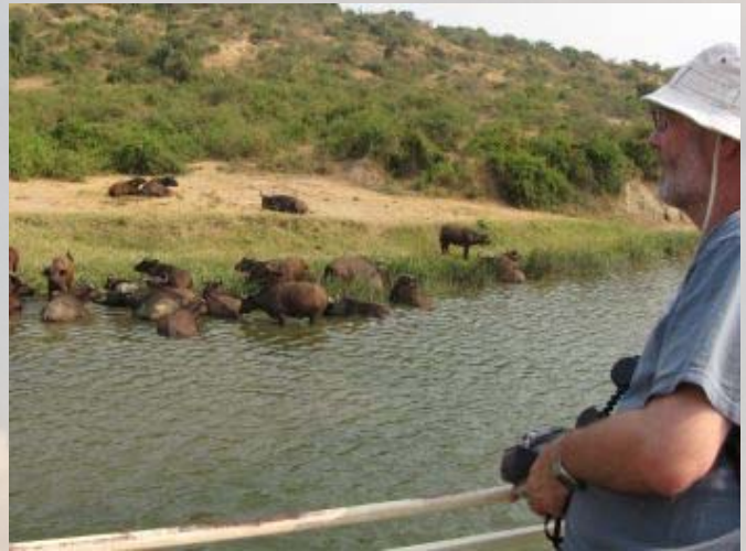
Tijdens de boottocht is erg veel wild te zien.