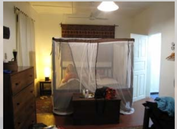
Ons hotel in Entebbe.

Gelukkig is de bagage aangekomen. We hadden er een beetje een hard hoofd in. In Amsterdam heeft de bagage een hele nacht in het depot gestaan en was mijn koffer, ondanks het doorlabelen, gewoon op de lopende band gezet. Goed dat we het even controleerden en de koffer aan een medewerker konden geven, die het weer in het depot terug zou plaatsen. Buiten staan er honderden mensen te wachten. Tussen de vele bordjes vinden we die met onze namen er op. Keurig geregeld. Het hotel, de Bomas, is vlak naast het vliegveld en we zijn er dan ook zo. Het is een gezellig hotelletje. Na het inchecken 'scoren' we ons eerste Nile biertje op het heerlijk koele terras. We zijn blij dat er nauwelijks muggen zijn. Alleen als we naar bed gaan zien we een tiental muskieten in ons muskietennet!