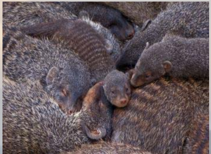
De dieren liggen er voor dood bij.