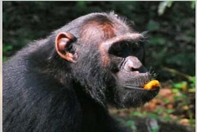
Rustig sabbelen aan een vrucht.