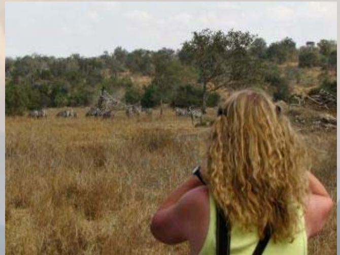
Tijdens de wandeling komen we veel wild tegen.