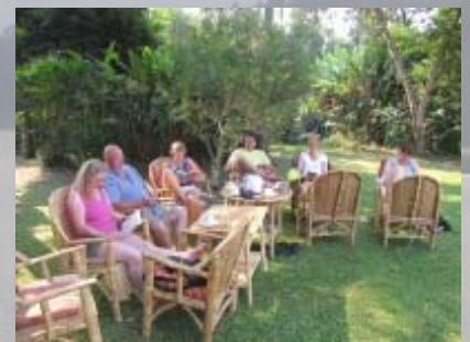
Fort Portal: rustdag

Het is warm als we tegen de middag naar het dorp lopen. Ik probeer foto's op de USB stick te plaatsen, maar krijg steeds foutmeldingen. Later blijkt dat de pc's vol virussen zaten en zowel mijn USB stick als de foto chip behoorlijk door die rommel is geïnfecteerd. Gelukkig zijn de foto's niet verloren gegaan. Ook even naar Nederland gemaild. Met Ans gaat het redelijk. Ze zit in een verzorgingshuis en revalideert langzaam. Het is allemaal een beetje vreemd. De dokter zegt dat ze een beroerte heeft gehad, maar daar zetten wij gezien haar geschiedenis sterke vraagtekens bij. In ieder geval is het niet levensbedreigend. Na het internetten zoeken we de rest van de groep op, die in een oud restaurant heeft geluncht. Vier mensen van de groep gaan een kraterwandeling maken. Ien is niet helemaal lekker zodat wij terug lopen naar ons hotel. We slaan echter te vroeg af en hebben geen idee meer waar we zijn. Na drie keer tevergeefs vragen nemen we maar een bode bode (bromtaxi) en laten ons achterop de motor naar het hotel brengen. Om 4 uur zijn we weer terug en zoeken het zonnetje in de idyllische tuin op. 's Avonds weer lekker 'bieren' en een aantal potjes boerenbridge gespeeld. Het kaartspel is behoorlijk populair deze reis!