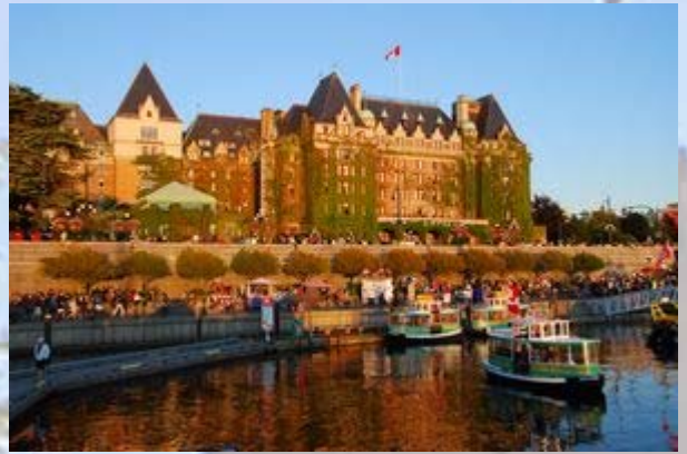
Victoria: Inner harbor met het Empress hotel

We kunnen het hotel (Strathcona) vrij makkelijk vinden. Het ligt midden in het centrum. Nadat we zijn ingecheckt gaan we de stad in. In de haven is een ponton waarop allerlei optredens zijn, variërend van pop tot klassiek. Er zijn ook stalletjes met prullen waar Ien haar hart op kan halen.