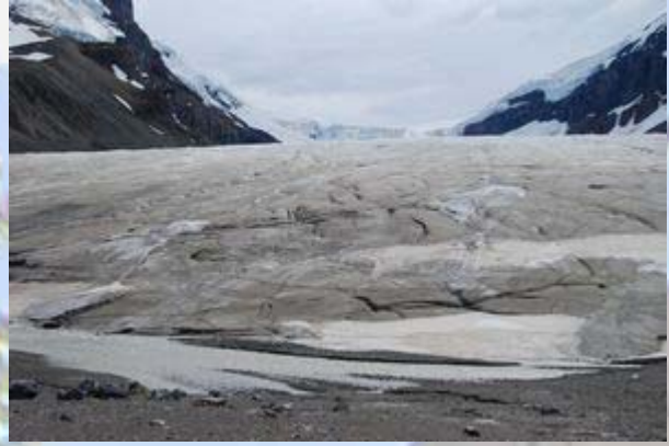
Columbia icefield: Athabasca gletsjer