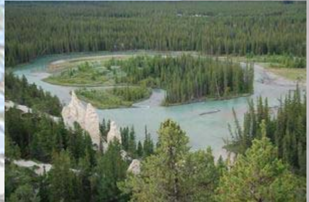
Bow river - de Hoedoes

Hierna rij ik even naar een mooi uitzichtpunt vlak bij het hotel. Bij de 'hoedoes', dit zijn geërodeerde zand pilaren, heb je één van de mooiste uitzichtpunten van de Rocky mountains. Hier stroomt de prachtig helder blauwe Bow rivier met op de achtergrond met sneeuw bedekte bergen. De hoedoes op de voorgrond en het plaatje is compleet. Prachtig.