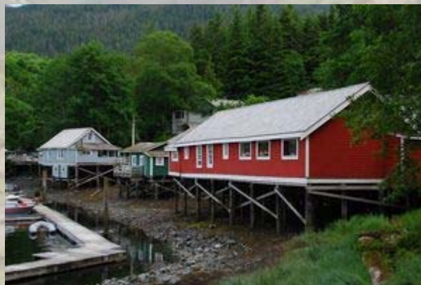
Telegraph Cove is op palen gebouwd.