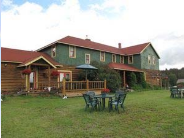
Chilcoton lodge (Riske Creek)

hartelijk De lodge is 80 jaar oud. Leuk ingericht, Hollandse gezelligheid. Net als bij ons thuis hangt de kerstverlichting het hele jaar door. We hebben een piepklein kamertje met een schattig hemelbed. In de lodge hebben we de beschikking over twee grote huiskamers. Het is verder wel primitief. Geen toilet op de kamer, de sloten doen het niet (klemmende deuren) en het is de enige plek deze vakantie waar we geen internet hebben. Het maakt de plek er echter niet minder leuk om. Naast een Canadese verpleegster, die hier voor haar werk is (Indianen instrueren hoe ze zelf in hun medische behoefte kunnen voorzien) zijn er verder geen gasten in de lodge.