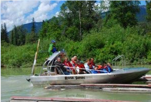
Berensafari in Blue river

Langs het meer leven ook visarenden (Ospreys) en de grote Bald eagle. We zien ze rond vliegen en pogingen doen een vis uit het water te halen. Dat is lang zo makkelijk niet, want geen enkele poging slaagt. Als een grote bruingekleurde zwarte beer zich laat zien is onze tijd om en varen we terug. Een heel geslaagd uitstapje.