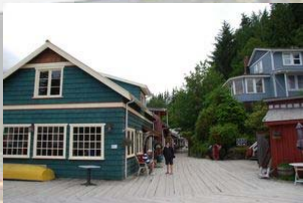
Op de bovenverdieping van het coffeeshouse slapen we.