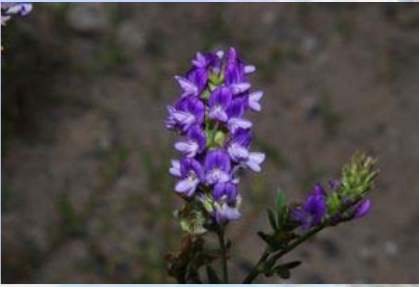
Fraaie bloemen in de Farwel canyon