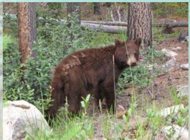
Een jonge zwarte beer met bruine vacht

Laat in de middag gaan we weer op pad. We rijden naar de Edith Cavell mountain, waar de gelijknamige gletsjer in een meertje uitkomt. Onderweg komen we een jonge zwarte beer tegen. Deze is bruin van kleur. Zwarte beren hoeven niet zwart te zijn, maar zijn soms ook bruin of zelfs licht grijs. Het dier is vlak naast de weg op zoek naar voedsel. Het keert stenen om op zoek naar insecten en stroop bosjes af naar besjes. We schatten in dat het dier net een jaar oud is.