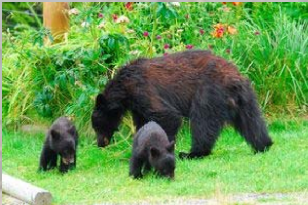
Zwarte beren op de parkeerplaats

We gaan pas tegen de middag naar het 60 km verderop gelegen Telegraph cove. Vlak voor we er zijn zien we bij een parkeerplaats een berin met 2 jongen. Ze eten tot onze verbazing gras, terwijl er overal besjes te vinden zijn. We kunnen geweldige foto's maken. Zo dichtbij hebben we ze nog niet gezien.