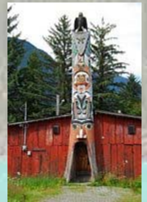
In Bella Coola staan een aantal totempalen.

Er is weinig te doen in Bella Coola. We rijden een stukje het dorp uit, maar al snel heb je een terreinwagen nodig om verder te gaan. De auto is helemaal bruin van de modderpaden. Aan de overkant is een carwash, waar je zelf met een spuit de auto kunt wassen. Er moeten muntjes in. Het blijkt een bodemloze put. Na $6 aan muntjes voor een paar minuutjes hogedruk water geven we het op. De auto is nog steeds vreselijk smerig. In de