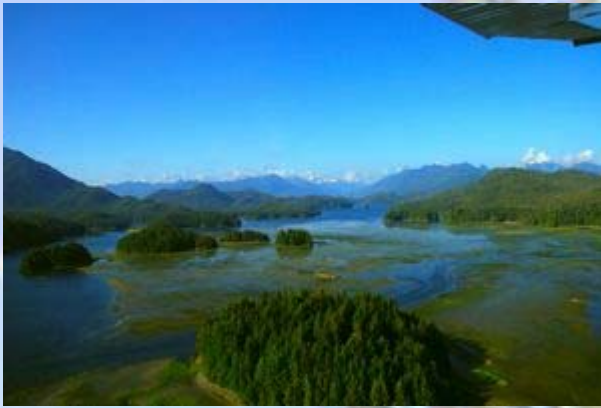
Vancouver Island vanuit de lucht

In Tofino gaan we meteen naar het restaurantje dat gisteren vol was (Shanti restaurant) en hebben een heerlijk plekje buiten op het terras. We hebben uitzicht over de haven en baai. De watervliegtuigjes en bootjes vliegen en varen af en aan.