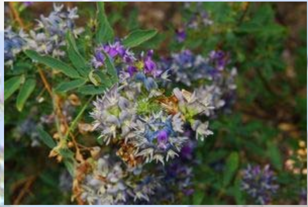
Het is wildflower seizoen.

We zijn net op tijd terug bij de auto. De blauwe hemel heeft plaats gemaakt voor donkere regenwolken en even later gaat het inderdaad regenen. De rest van het rondje voert ons langs de vele farms. Veel land is in cultuur gebracht. Ook rijden de grote vrachtwagens met gekapte boomstammen af en aan. Ze ontwikkelen een grote stofwolk waardoor je de weg niet meer kunt zien.