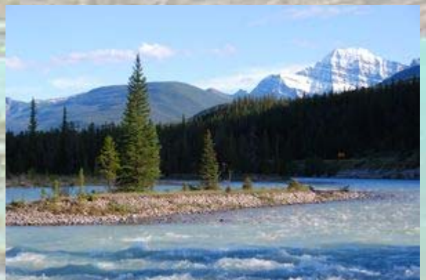
Uitzicht vanaf Beckers bungalows

Via het Mount Robson park verlaten we de Rocky mountains. Onderweg speuren we in de ontelbare poeltjes tevergeefs naar elanden. Het enige wild dat we zien is een doodgereden jong beertje midden op de weg. Bij een camping gaan we er nog even uit voor een korte wandeling naar een meer waar zich een beverdam moet begeven. We moeten een stuk door een bos en als we een grote drol op het pad tegen komen heeft Ien het niet meer naar haar zin. Bij het meer aangekomen kunnen we nergens de beverdam ontdekken. Als we weer terug bij de camping de auto willen keren rijdt Ien achteruit tegen een boom. Au. Ze vroeg nog of er niets was en ik zei op de automatische piloot ‘Ja’. De rechter achterkant is behoorlijk ingedeukt en de schade is aanzienlijk. Later blijkt dat Askja ons all risk heeft verzekerd, iets wat we zelf nooit doen. Wat een mazzel. De premie is zo hoog dat je om de 4 keer de auto in de prak moet rijden om het eventuele eigen risico er uit te hebben.