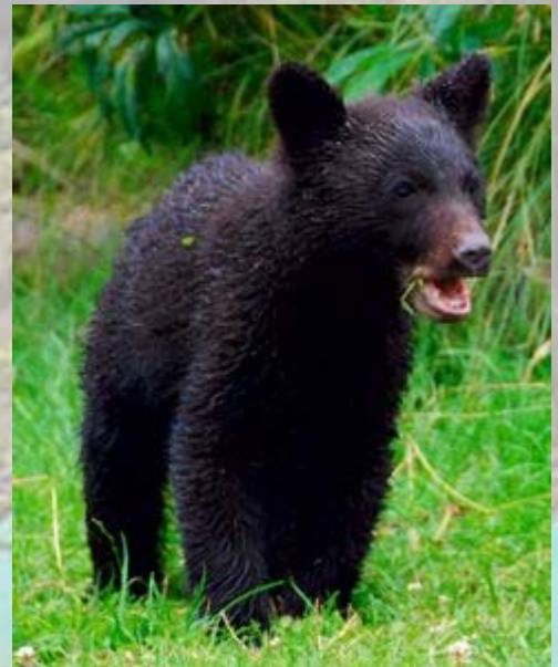
Tot onze verbazing eten ze gras.

Iets verderop steekt er een hert over. Het is een 'black tailed deer', een soort die alleen op het eiland voor komt. Het eet aan de kant van de weg rustig wat blaadjes van een boom alvorens de weg weer over te steken. Nu zien we pas dat daar twee jonkies staan. Ze hebben nog hun bambi stippenpak. Erg leuk.