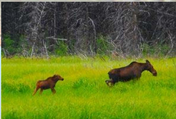
Elanden in de swamps

Het is maar een klein stukje naar Bella Coola, waar vandaan we met de ferry weer naar de bewoonde wereld zullen varen. We hebben de tijd en vertrekken pas tegen het middaguur. als we een kwartier onderweg zijn komen we er achter dat we mijn mobiele telefoon niet bij ons hebben. Balend rijden we terug.