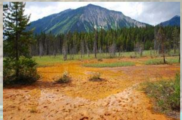
Kootenay - De paint pots

We rijden verder de weg naar het zuiden. Langs de weg zien we regelmatig hertjes grazen. De uitzichtpunten zijn, vergeleken met Banff, weinig spectaculair. We rijden tot de likplaats, waar soms dieren mineralen komen oplikken. Er is niets te zien en we besluiten terug te gaan. Het zuiden van Kootenay moet wat spectaculairder zijn (meer bos en veel beren), maar dat doen we wel een andere keer.