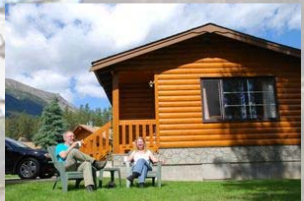
Becker chalets in Jasper

Heerlijk geslapen. Desondanks vroeg op om met de auto een rondje te maken. We nemen de 93A, dit is de alternatieve route aan de andere kant van de Icefield Highway. Het is hier dicht bebost en behalve veel muggen lijkt hier niet veel te zitten. We nemen de afslag naar Lake Moab. Een gravel weg, die midden in het bos eindigt. Ien protesteert hevig, maar we lopen toch richting het meer. Ien zingt uit volle borst alle kinderliedjes die ze kent om eventuele beren op een afstand te houden. Het is maar 200 meter, maar als er een enorme, verse berendrol op het pad ligt gaan we maar terug. Jammer van al die bevers en elanden die een stukje verderop op ons zaten te wachten. Pas als we bijna terug zijn zien we een enorme elk (soort edelhert) langs de weg staan.