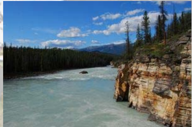
De rivier waarin de Athabasca waterval uitkomt