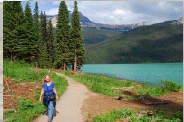
Wandeling Lake Emerald