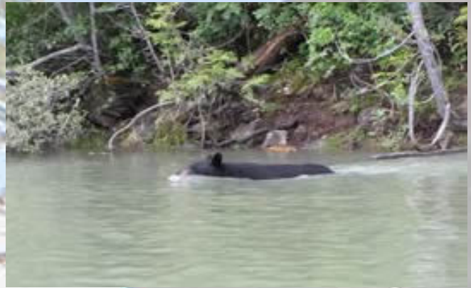
Zwemmende zwarte beer

Als we Clearwater naderen verdwijnt de zon en gaat het regenen. We overnachten weer in de Blue Grouse Inn. Hier hebben we 9 jaar geleden ook overnacht. Het was toen net open. We worden hartelijk ontvangen door Regina. Ook hier stikt het van de muggen. Het is een extreem jaar. In Clearwater regent het de hele zomer al. Alles is nat en blubberig en de muggen vieren feest. We eten in een verderop gelegen ranch.