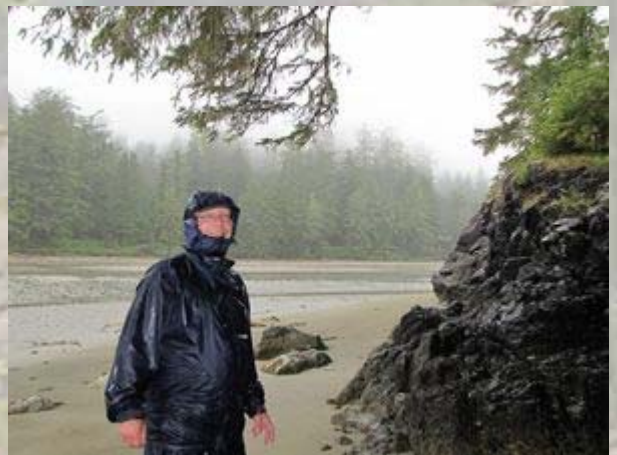
Regenkleding aan en gaan !!

Ucluelet voor een pizza. 'Onze' tent is echter net aan het verbouwen, waarna we in een klein en drukbezocht restaurantje terecht komen. In een hoekje proppen we snel wat naar binnen werken. Hierna in de regen en het donker weer terug naar Tofino, waar we in onze lodge nog even bij het haardvuur een wijntje drinken.