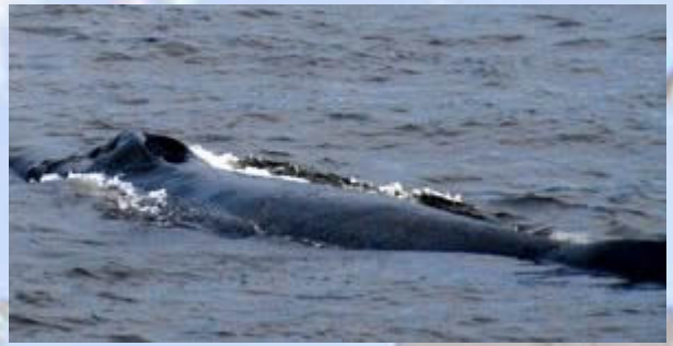
Wat een enorme 'neusgaten !!'

Om 13:00 hebben we een orca-toer geboekt van 3,5 uur. We hebben er helemaal zin in met dit weer. Na de nodige instructies varen we uit. Ien ontdekt meteen al een spuitende walvis. De boot vaart de andere kant op. We denken naar de orca's, maar als de kapitein na een kwartier te horen krijgt dat er een walvis is gespot, varen we terug naar de walvis die Ien bij vertrek al had gezien. Het blijken er zelfs drie te zijn. Het zijn bultruggen (humpback whales). We blijven er heel lang bij en kunnen de dieren meerdere malen goed zien.