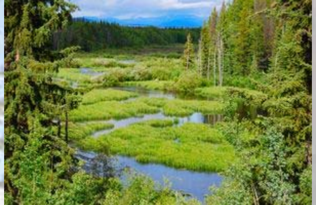
Een van de vele swamps die je onderweg tegen komt.