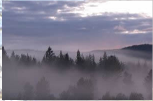
Avond valt over Wells Grey