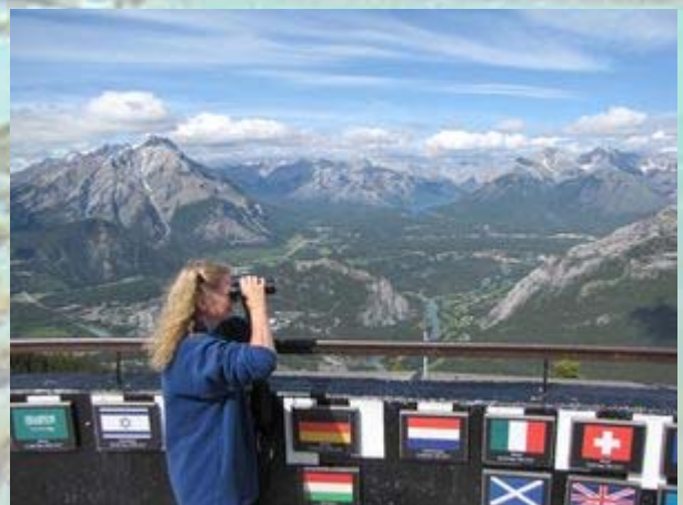
Uitzicht over Banff

Even verderop is de kabelbaan. Hier is het al niet anders. Er staat een rij van een uur, terwijl de kabelbaan zichtbaar in de hoogste stand is gezet. We trotseren de massa en wachten geduldig tot we aan de beurt zijn. Na een uur mogen we naar boven. Vanuit de gondel, beter nog dan boven, heb je een mooi uitzicht over Banff en de omliggende bergen. Boven is echter behalve een steile klim naar een ander uitzichtpunt niets te doen. Achteraf was de gondel een beetje zonde van de tijd en het geld ($60). Leuk is in ieder geval een wat mottige 'bighorn sheep', die onder aan de balustrade hoopt op wat kruimels van de rij wachtende mensen. Ons eerste grote 'wild'.