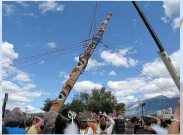
Recht zetten van de nieuwe totempaal

Aan het eind van de middag gaan we nog een kort ritje maken in het park. Eerst naar een meer waar een beverdam moet zijn. Als we er aan komen vinden we alleen een grote groep zwemtoeristen. Even verderop is een likplaats van mountain goats en bighorn sheep. Ook deze plek wordt verpest door toeristen die over het hek zijn geklommen en alle dieren hebben verjaagd. De rit was toch niet voor niets, want het uitzicht is prachtig.