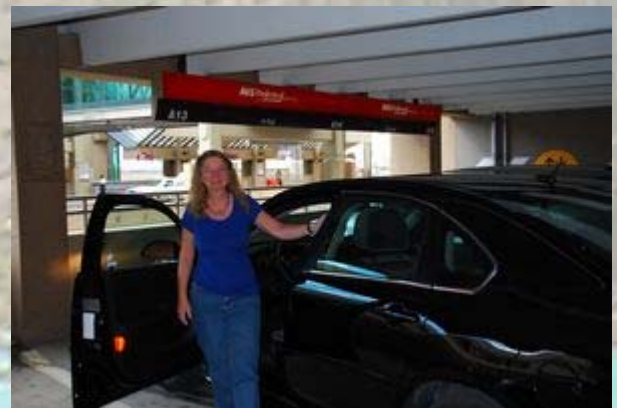
Onze Chevrolet Impala

Bij AVIS halen we de huurauto op. Het is een luxe Chevrolet Impala. Alleen de kleur, zwart, had wat vrolijker gemogen. Het is een nieuwe auto, die van alle nieuwe snufjes is voorzien. We zien af van alle toeters en bellen (extra dit, extra dat) die ze ons aan willen smeren en rijden om 16:00 het vliegveld af. Het is 145 km rijden naar Banff in de Rocky Mountains. Een mooie route. Het is redelijk mooi weer, maar hoe dichterbij Banff komen, hoe somberder het wordt. Banff ligt midden in het Banff National park. Bij de gate kopen we een jaarkaart voor alle Canadese parken voor ca. $140,-. In Canada zijn ze helemaal gestoord. De belasting op alles wordt apart berekend, zodat de zo mooi afgeronde prijzen veranderen in $142,34 of $7,88. We snappen nog niets van het geld en bij elke aankoop krijgen we een handvol muntjes terug.