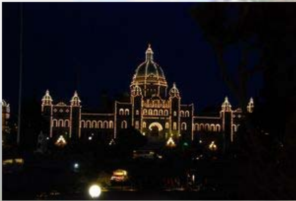
Victoria: 's Avonds wordt het parlamentsbouw fraai verlicht.

Victoria ligt beschut tussen de bergen, waardoor het hier vaak het beste weer van het eiland is. Ook nu is het heerlijk weer, terwijl we vanmorgen met een dik wolkendek uit Tofino vertrokken.