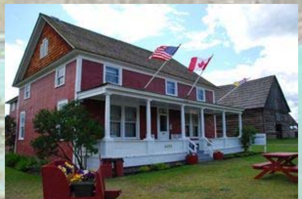
108 House museum

We volgen de goldrush route naar het noorden. Begin vorige eeuw werd hier goud gevonden, wat een ware stormloop van gelukzoekers op gang bracht. Namen als 100 House en 150 House herinneren aan bevoorradingsplaatsen op de route. Bij 108 House is een museumdorp ingericht, waar ze historische huizen uit de omgeving samen hebben gebracht. Er is naast het museum zelf, waar een aantal kamers zijn ingericht, onder andere ook een oud schooltje, een kerk en de hut van de smid te zien. Een welkome onderbreking.