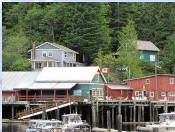
Het groene huisje is ons coffeeshouse

We eten in het gezellige restaurant naast ons. Hierna maken we nog een rondje door het inmiddels verlaten dorpje.