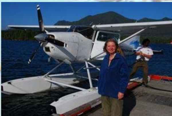
Met het watervliegtuig terug naar Tofino

's Middags hebben we een tour geboekt naar de hot springs. Het is stralend weer als de boot vertrekt. Het is een eindje varen tussen de prachtige eilandjes. Onderweg heb je grote kans op walvissen en die zien we dan ook volop. Het zijn allemaal grijze walvissen. Veel lichter van kleur dan de bultrug. Ze komen af en toe even boven, maar laten zelden hun staart zien. Eenmaal stoppen we even een paar minuten bij een grijze walvis, maar hierna vaart de schipper met een grote boog om de walvissen heen. Een flinke tegenvaller, want Barb had deze tour aangegeven als goed alternatief voor een walvissafari. Vlak voor we bij de hot springs zijn stopt de boot even op enige afstand van een groepje grijze walvissen. De schipper gooit zijn hengel uit en hoopt een grote zalm te vangen. Hij heeft meteen beet, maar tot zijn teleurstelling is het een red snapper. Ook heel lekker, maar helaas voor de schipper op de markt veel minder waard. De snapper wordt dan ook meteen weer terug gezet. Op de boot zijn ook drie Japanners. Elke keer als een walvis zijn rug laat zien schreeuwen ze het uit. Niet te volgen die taal, maar ik meen toch even 'sushi sushi' te verstaan.