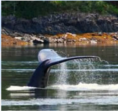
Staart van een bultrug (humpback)

Tussendoor komen we ook robben en dolfijnen tegen. De dolfijnen zwemmen in kleine groepen en behalve af en toe een vin zijn ze moeilijk te zien. We varen naar de overkant van de Johnson straat. Ook hier geen orca's. Er moet wel een Minke whale (dwerg vinvis) zijn, maar die is erg moeilijk te spotten omdat hij maar even een klein stukje boven komt. Het uitzicht is oogverblindend mooi. Prachtige eilandjes en besneeuwde toppen. Flinke tegenvaller is wel dat we de orca's ook dit keer niet te zien krijgen. Gelukkig zagen we ze gisteren wel vanuit ons huisje.