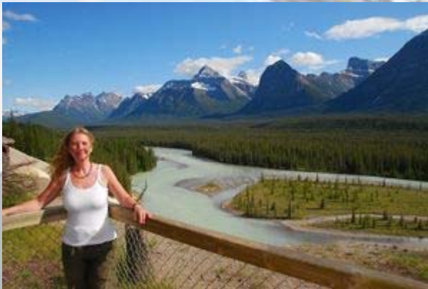
Uitzicht bij de likplaats

’s Avonds eten we in het Best Western hotel. Volgens de website kun je er fonduen, maar daar hebben we nog nooit van gehoord. Het alternatief was ook prima.