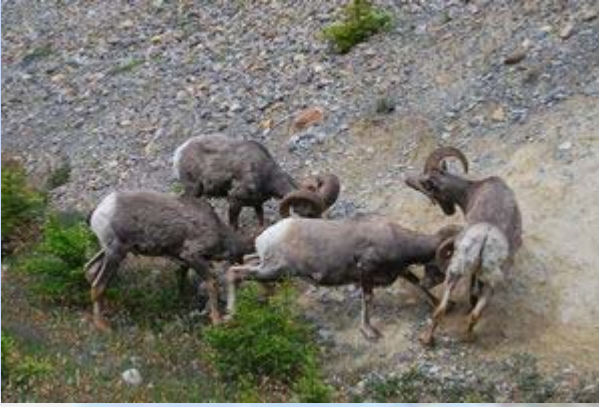
Vechtende bighorn sheep