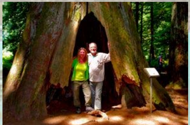
De enorme Douglas fir trees van Cathedral Cove

Langs de weg in het midden van het eiland rijden we door de oerbossen van het eiland. Bij Cathedral grove zijn er korte wandelingen uitgezet door het eeuwenoude bos. Hier groeien tot 800 jaar oude pine trees. De grootste heeft een diameter van 9 meter en is 76 meter hoog. Ter vergelijking staat op een plaat de boom naast de toren van Pisa, die bij de boom in het niet valt. In 1997 heeft een orkaan veel bomen omver geblazen. Deze reuzen liggen kris kras door het woud en dienen als voedingsbodem voor nieuwe aanwas.