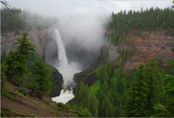
Wells Grey - De Helmcken watervallen

’s Avonds barbecueën we met z’n vieren bij de ranch. De man die het vlees braait blijkt de man van Regina te zijn. Ze hebben het leuk ingericht. We zitten in een hokje met de vorm van een huifkar. Het is een prima stukje vlees en het is met z’n vieren erg gezellig. Als we tegen donker naar huis gaan is er een mysterieuze mist over de velden neergedaald. een prachtig gezicht. Om 21:30 zijn we weer terug.