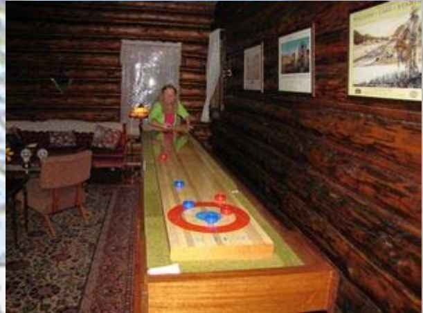
Canadees spel: shuffleboard