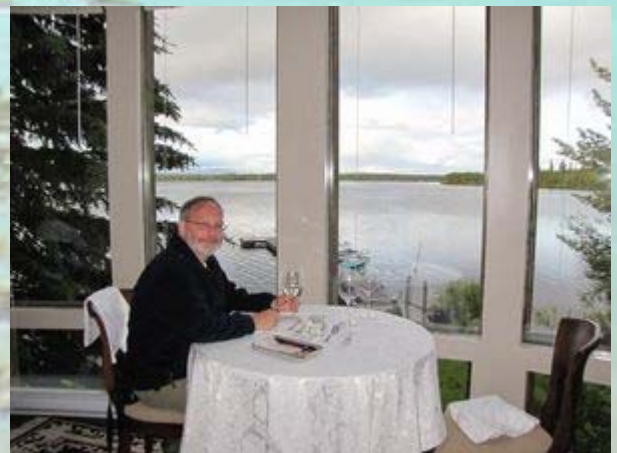
Mooi uitzicht bij diner Eagle's nest resort

De weg over de Heckman pass, die de afgelopen dagen afgesloten was na aardverschuivingen, is weer enkele uren per dag open. We nemen hebben er goede hoop op dat we overmorgen Bella Coola kunnen bereiken voor de ferry naar Vancouver Island. We nemen dus highway 20 naar Anahim Lake. Een mooie route van 260 km over de oude goldrush route. Het is een mooie route. Af en toe een kleine nederzetting, maar verder alleen bos. We passeren veel begroeide meren en poeltjes. Ideaal voor elanden, maar die laten zich vandaag niet zien. Halverwege steekt er wel een beer over de weg om aan te geven dat we wel degelijk in de wildernis zitten.