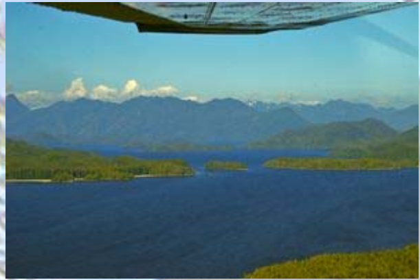
Vancouver island vanuit de lucht